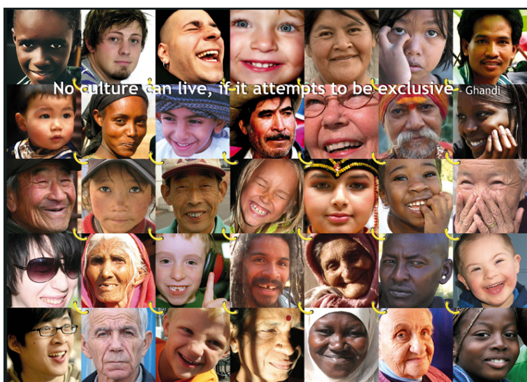
Ontwerp flyer RelizappInCultures ↑

Bij dit filmprogramma hoort een programmaboekje waarin enerzijds de films en anderzijds het project MultiMovies en RelizappInCultures worden toegelicht. Op deze manier willen we bewerkstelligen dat mensen over de films en hun thematiek nadenken en erover gaan praten. RelizappInCultures beoogt mensen vanuit verschillende religies en culturen bij elkaar te brengen en met elkaar te verbinden. Dit gebeurt op meer plaatsen in de wereld, zij het op een andere manier. MultiMovies laat zien hoe op verschillende plekken in de wereld met multiculturaliteit wordt omgegaan.